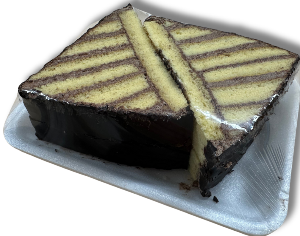
PIRAMIS SZELET /200 g/