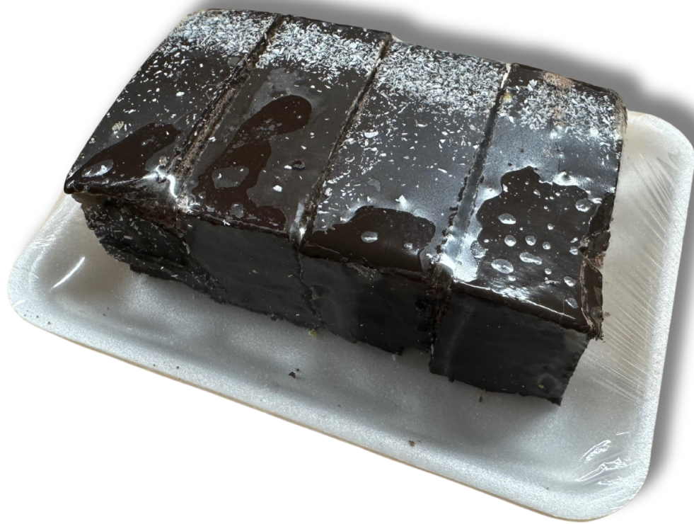
FANTÁZIA SZELET (200 g)