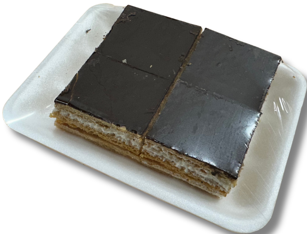
MÉZES KRÉMES (200 g)